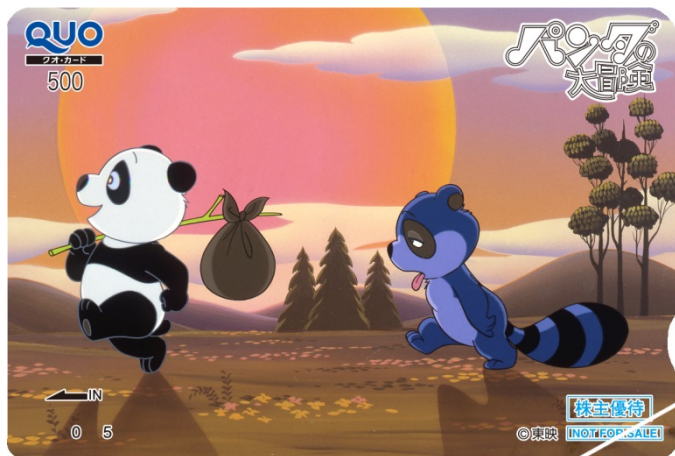
名作「パンダの大冒険」