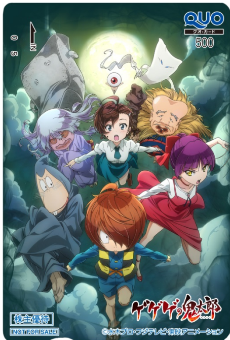
新作「ゲゲゲの鬼太郎」